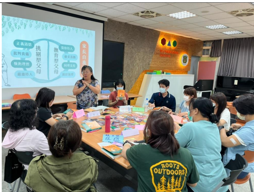
照片說明：透過抽排卡體驗，讓家長覺察並認知自身為何型態的父母。