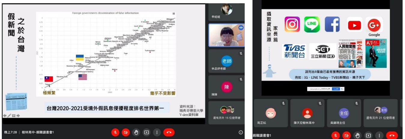
照片說明：透過視訊會議連結，探討網路相關新聞事件的真假辨識。