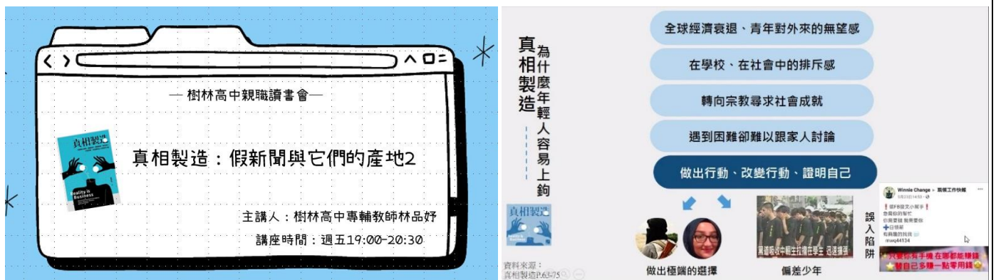
照片說明：透過辦理親職讀書會相關簡報，介紹網路不實訊息對青少年之影響。