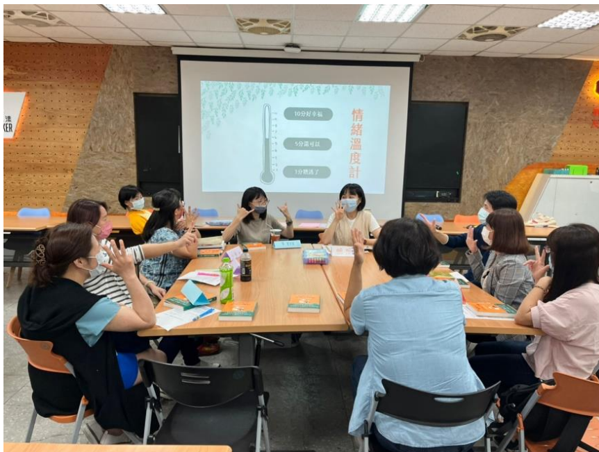
照片說明：透過心情溫度，引導家長覺察自身的狀態。